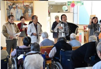
老健施設訪問活動